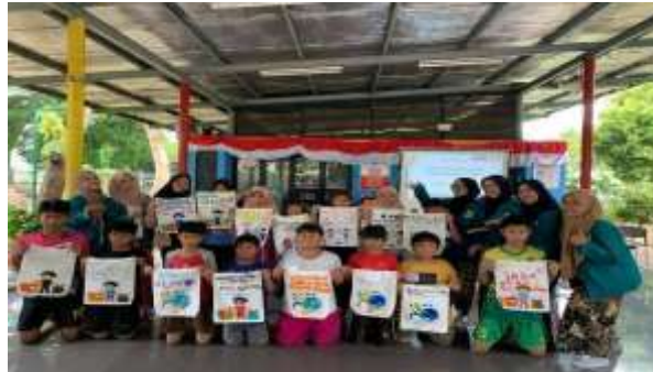
Gambar 5. Foto bersama peserta dan tote bag yang dihasilkan

Peserta belajar menyampaikan gagasan secara kreatif, baik melalui simbol visual gambar maupun kata-kata. Berikut adalah dokumentasi bersama peserta dan tote bag hasil karya mereka yang menunjukkan beragam kreativitas dan antusiasme anak-anak dalam mengikuti kegiatan ini.