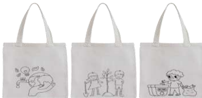
Gambar 3. Desain tote bag

Setelah penyampaian materi, peserta diajak untuk berkreasi dengan media tote bag . Kegiatan ini bertujuan mengajak peserta mengenal dan terlibat dalam upaya pelestarian lingkungan. Peserta diberikan tote bag yang sudah terdapat gambar terkait ajakan peduli terhadap lingkungan. Peserta diberikan kebebasan melukis tote bag yang telah disediakan. Melalui kegiatan melukis, peserta diajak untuk memvisualisasikan pesan atau materi yang telah mereka dapat sebelumnya. Lalu, membagikan pesan tersebut kepada orang lain melalui karya seni hasil tangan mereka sendiri. Selain itu, tote bag yang telah mereka buat memiliki nilai guna karena dapat digunakan kembali dan mengurangi penggunaan plastik sekali pakai. Berikut desain pada tote bag .