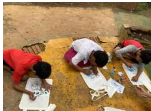
Gambar 4. Kegiatan pembuatan poster melalui tote bag

Melalui kegiatan ini, peserta tidak hanya melatih keterampilan motorik halus mereka saat melukis, tetapi, juga meningkatkan kompetensi literasi visual dan verbal.