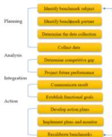
Gambar 1. Implementasi Benchmarking adopsi [15]

Berkembang tidaknya suatu lembaga pendidikan tergantung dari kinerja di dalamnya. Untuk meningkatkan kinerja tersebut banyak hal yang dilakukan, diantaranya bagaimana pemimpin membantu meningkatkan kinerja lembaga di bidang pengembangan daya saing yang salah satunya melalui benchmarking.