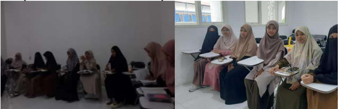
Gambar 1. Dokumentasi saat & setelah Penelitian

Berdasarkan hasil penelitian yang telah peneliti peroleh, data dikumpulkan melalui penggunaan penelitian metode kuantitatif. Penelitian ini dilaksanakan pada bulan Desember semester ganjil Tahun Akademik 2025/2026. Peneliti menggunakan kelas pada level pertama ( Mustawā Awwal ) MUBK, Universitas Muhammadiyah Sidoarjo karena menjadi tempat yang relevan bagi peneliti. Berikut merupakan dokumentasi yang peneliti ambil pada saat dan setelah melaksanakan penelitian :