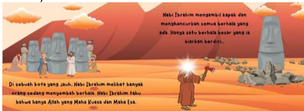
Gambar 2. Tampilan Desain Pop Up Book

Desain Pop Up Book ini dirancang sebagai media pembelajaran interaktif yang menggabungkan unsur visual, tekstur dan juga gerak untuk dapat menyampaikan kisah sejarah Nabi Ibrahim AS secara menarik dan edukatif. Buku ini ditujukan untuk peserta didik jenjang pendidikan dasar sebagai bagian dari materi Pendidikan Agama Islam (PAI), khususnya pada tema keteladanan para nabi.