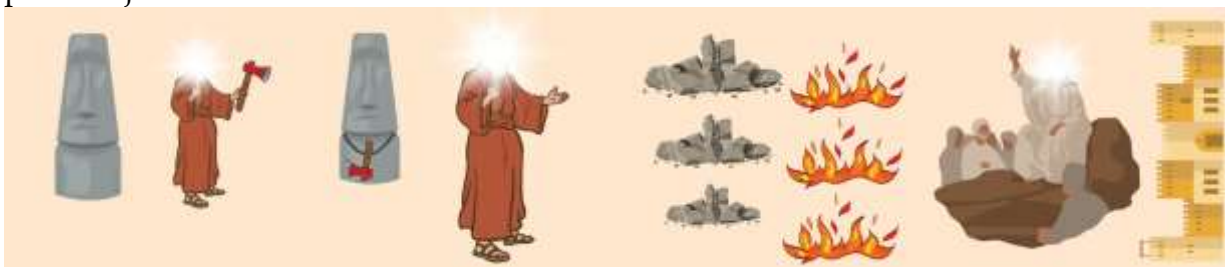
Gambar 3. Tampilan Elemen 3D

Desain pada buku dilengkapi dengan narasi singkat dan sederhana yang sesuai dengan tingkat pemahaman peserta didik. Ilustrasi dibuat dengan memberikan sentuhan warna dan ekspresi agar dapat memancing rasa ingin tahu dan juga memperkuat daya ingat visual peserta didik. Melalui Pop Up Book ini, peserta didik diharapkan tidak hanya menerima materi secara pasif, akan tetapi juga dalam terlibat aktif dalam setiap proses pembelajaran.