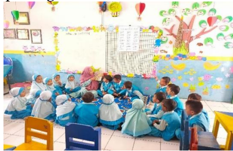
Gambar 3: Kegiatan pembelajaran dimulai dengan materi pagi dan bercerita

Pada kegiatan penutup, anak-anak diajak untuk melakukan evaluasi melalui sesi tanya jawab mengenai kegiatan yang telah mereka lakukan ( recalling ), menanyakan apa saja kegiatan yang telah mereka lakukan selama sehari, kegiatan apa saja yang paling menyenangkan bagi mereka, dengan tujuan agar mereka dapat mengingat kembali dan memahami makna dari kegiatan yang telah dilaksanakan. Setelah itu, kegiatan dilanjutkan dengan menyampaikan pesan-pesan dari guru, dilanjutkan dengan berdoa kegiatan penutup sebelum anak-anak pulang.