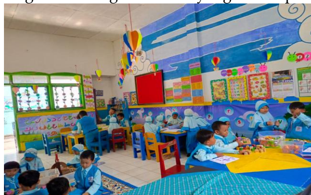
Gambar 4: Kegiatan pembelajaran dengan model kelompok

Berbeda dengan pendekatan konvensional dalam penyusunan silabus, RPP, atau modul ajar, pendekatan berbasis pembelajaran kelompok yang diterapkan di TK Islam Terpadu Al-Amri Leces Probolinggo menekankan pada rangkaian kegiatan bermain yang mencerminkan pusat pembelajaran pada siswa. Ini menunjukkan pendekatan pembelajaran yang lebih interaktif dan memberikan peran aktif kepada siswa dalam proses belajar mengajar, serta memanfaatkan sumber daya alam. Kendala dalam merencanakan pembelajaran kelompok di TK Islam Terpadu Al-Amri Leces Probolinggo terutama disebabkan oleh kurangnya pemahaman beberapa guru terhadap konsep manajemen kelas PAUD yang berbasis pembelajaran kelompok. Namun, untuk mengatasi masalah tersebut, berbagai upaya diusulkan. Salah satu solusi yang diajukan adalah melalui kerja sama dan komunikasi yang baik antar guru untuk meningkatkan kompetensi pendidik melalui diskusi internal dan berbagi praktik terbaik. Supervisi yang dilakukan oleh kepala sekolah, pelatihan, atau kegiatan pengembangan lainnya juga dianggap urgent. Melalui keikutsertaan aktif dalam kegiatan seperti Kelompok Kerja Guru (KKG), pendidik diharapkan dapat saling mengevaluasi, memberikan kritik dan saran, serta bersama-sama mencari solusi untuk mengatasi berbagai masalah yang dihadapi.