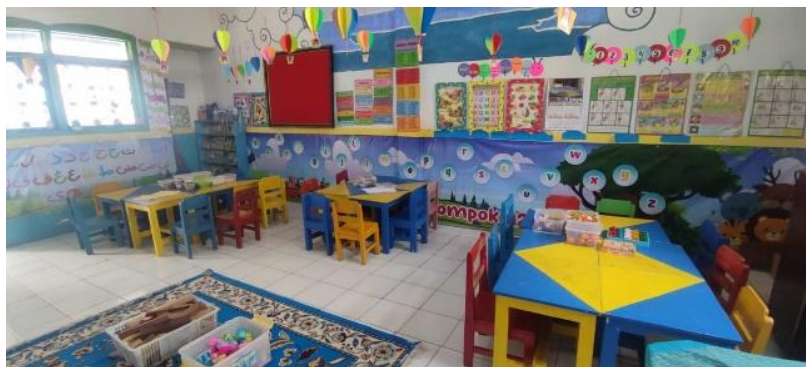
Gambar 2: Panataan lingkungan main pada pembelajaran kelompok

Temuan penelitian menunjukkan bahwa guru di TK Islam Terpadu Al-Amri telah berhasil menerapkan perencanaan pembelajaran dengan model pembelajaran kelompok sesuai dengan komponennya. Mereka secara terstruktur menyusun silabus dan RPP menggunakan model pembelajaran kelompok melalui kegiatan pengembangan guru. Laporan kegiatan harian anak dalam kegiatan pembelajaran di sekolah disampaikan kepada orang tua melalui Buku Penghubung, sedangkan laporan triwulan diberikan kepada wali murid setiap tiga bulan, serta laporan perkembangan anak disampaikan setiap semester.