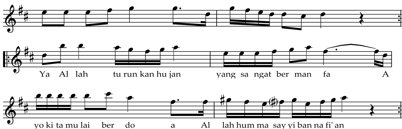
Gambar 1. Partitur Lagu Hujan