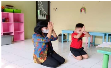
Gambar 6. Kelas Buddha

Kelas keempat adalah kelas Buddha. Materi pembelajaran yang diajarkan oleh guru yang pertama adalah pada nama tempat ibadah. Guru membimbing anak untuk menyebutkan kata “Vihara”. Kedua adalah pengenalan tata cara beribadah, setelah diberikan penjelasan maka selanjutnya adalah praktek langsung cara beribadah dibimbing oleh guru agama seperti yang terlihat pada gambar 6. Kegiatan terakhir di kelas Buddha adalah bercakap-cakap mengenai cara bersikap orang Budha apabila ada saudaranya yang mengalami kesusahan, sesuai dengan tema yang diusung pada Satu Saudara kali ini yaitu tentang indahnyaberbagi.