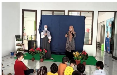
Gambar 8. Kelas Toleransi

Tahap terakhir dalam program Satu Saudara adalah pelaksanaan kelas toleransi. Teknis dan konsep pelaksanaan kelas toleransi dapat berbeda setiap tahunnya, artinya tema yang diangkat dalam setiap tahunnya tidaklah sama. Guru selalu memunculkan ide-ide baru dalam pelaksanaan Satu Saudara dimana tema yang diangkat akan mempengaruhi konsep kegiatan pada kelas toleransi yang dilaksanakan. Berdasarkan penuturan dari guru, program ini akan terus dievaluasi, dan menjadi salah satu tantangan bagi guru untuk terus melakukan perbaikan-perbaikan.