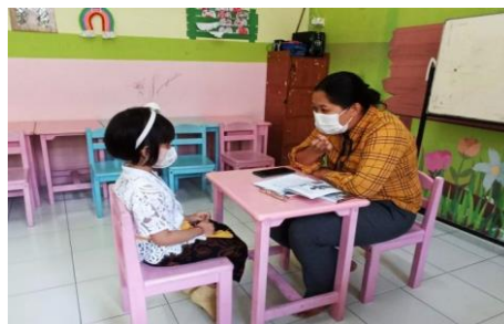
Gambar 7. Kelas Hindu

Kelas keempat adalah kelas Buddha. Materi pembelajaran yang diajarkan oleh guru yang pertama adalah pada nama tempat ibadah. Guru membimbing anak untuk menyebutkan kata “Vihara”. Kedua adalah pengenalan tata cara beribadah, setelah diberikan penjelasan maka selanjutnya adalah praktek langsung cara beribadah dibimbing oleh guru agama seperti yang terlihat pada gambar 6. Kegiatan terakhir di kelas Buddha adalah bercakap-cakap mengenai cara bersikap orang Budha apabila ada saudaranya yang mengalami kesusahan, sesuai dengan tema yang diusung pada Satu Saudara kali ini yaitu tentang indahnyaberbagi.