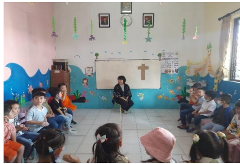
Gambar 4. Kelas Kristen

Kedua, kelas Kristen. Pada gambar 4, guru agama menceritakan sebuah kisah tentang Daud dan Goliath dan membimbing anak untuk menghafalkan ayat tertentu. Setelah itu, guru agama mengajak mereka bersama-sama menyanyikan lagu sekolah minggu diiringi oleh alat musik yang dimainkan oleh Ibu CRM selaku salah satu pendamping di kelas tersebut. Anak-anak sangat bersemangat saat diajak bernyanyi. Perlengkapan yang disiapkan oleh guru dalam mendukung pembelajaran diantaranya adalah tanda salib yang diletakkan di papan tulis, Alkitab, dan gitar untuk mengiringi nyanyian.