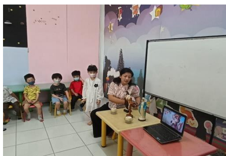
Gambar 3. Kelas Katholik

Begitupun dengan agama-agama yang lain, guru melakukan hal yang sama. Setelah masing-masing agama selesai maju ke depan, guru memberi arahan pada anak terkait kegiatan yang akan dilakukan selanjutnya yakni belajar di kelas agamanya masing-masing. Sekolah mendatangkan 5 guru agama untuk memberikan pengetahuan dan keterampilan pada anak terkait agama yang dianutnya mulai dari tata cara beribadah, berdo'a, dan lain sebagainya. Disamping guru agama, anak juga didampingi oleh guru lain yang bertugas di kelas tersebut. Sebelumnya, guru juga telah menginformasikan pada semua anak untuk menggunakan pakaian dan atribut lain yang sesuai dengan agamanya.