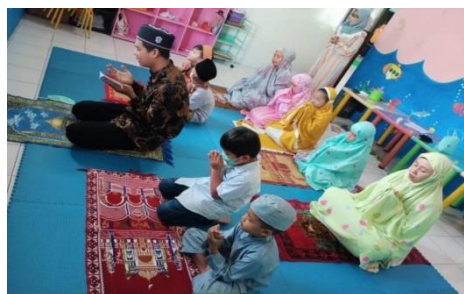
Gambar 5. Kelas Islam

Kedua, kelas Kristen. Pada gambar 4, guru agama menceritakan sebuah kisah tentang Daud dan Goliath dan membimbing anak untuk menghafalkan ayat tertentu. Setelah itu, guru agama mengajak mereka bersama-sama menyanyikan lagu sekolah minggu diiringi oleh alat musik yang dimainkan oleh Ibu CRM selaku salah satu pendamping di kelas tersebut. Anak-anak sangat bersemangat saat diajak bernyanyi. Perlengkapan yang disiapkan oleh guru dalam mendukung pembelajaran diantaranya adalah tanda salib yang diletakkan di papan tulis, Alkitab, dan gitar untuk mengiringi nyanyian.