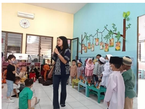
Gambar 2. Apersepsi Program Satu Saudara

Tahap pertama adalah apersepsi. Sebelum masuk dalam kegiatan inti, guru mengajak seluruh anak kelompok A dan kelompok B untuk berkumpul bersama di aula terlebih dahulu. Pada kegiatan apersepsi awal, guru mengajak anak bercakap-cakap mengenai keberagaman agama yang ada di Indonesia menggunakan media miniature tempat ibadah. Dalam hal ini, guru mengaitkan pengetahuan dan pengalaman yang telah dimiliki anak dengan materi yang disampaikan.