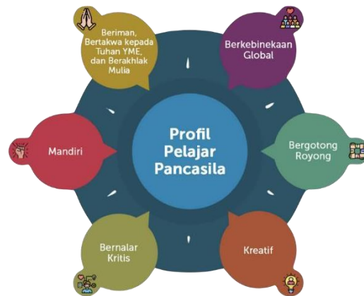
Gambar 2. Dimensi kunci Profil Pelajar Pancasila [5].