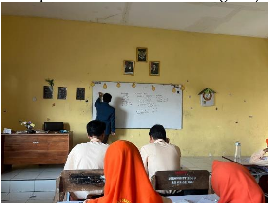
Gambar 1. Pemaparan materi matematika pada siswa kelas 11

Berikutnya dalam tahapan pelaksanaan, kegiatan mengajar dilakukan di dalam ruang kelas yang meliputi penyampaian materi, latihan soal, pendampingan siswa dalam mengerjakan latihan soal, pembahasan latihan soal, dan diskusi dengan siswa terkait dengan pemahaman materi ajar yang disampaikan terutama jika siswa belum dapat memahami materi yang dirasa sulit. Materi fungsi aljabar yang disampaikan mencakup beberapa sub materi, yaitu pengenalan jenis-jenis fungsi, menggambar grafik fungsi, operasi aljabar fungsi, hingga komposisi dan invers fungsi. Kesulitan yang dialami siswa adalah pada operasi dan sifat-sifat aljabar yang belum dipahami dengan baik. Dengan demikian, peran asisten mengajar adalah memberikan konsep dasar operasi aljabar agar siswa dapat memahami materi fungsi aljabar secara optimal.