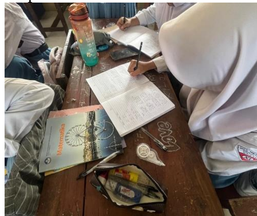
Gambar 2. Sesi latihan soal dan diskusi