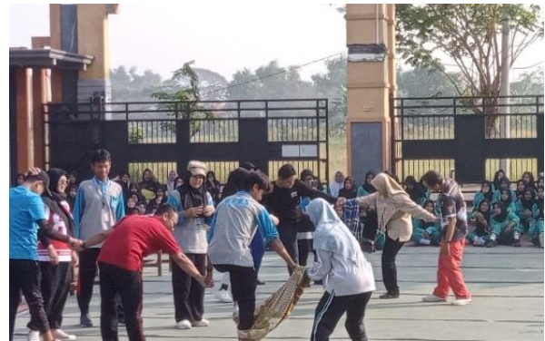
Gambar 4. Lomba menyambut HUT RI ke-80

Pada kegiatan administrasi guru, peran mahasiswa adalah melakukan rekap kehadiran siswa di setiap kelas pada jam pelajaran matematika, mengisi jurnal mengajar harian, mengoreksi tugas yang dikerjakan oleh siswa, membuat soal ulangan matematika, mengoreksi hasil ujian matematika yang dikerjakan siswa, hingga melakukan rekap nilai hasil ulangan siswa. Selain itu, mahasiswa juga membuat logbook dan laporan hasil kegiatan program Asistensi Mengajar yang telah dilakukan. Logbook dan laporan yang dibuat oleh mahasiswa merupakan bentuk pertanggungjawaban kegiatan Asistensi Mengajar pada pihak sekolah dan pihak program studi di kampus.