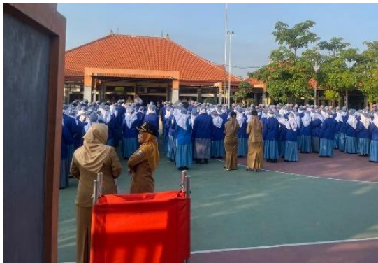
Gambar 3. Pelaksanaan upacara bendera

Dalam kegiatan non-mengajar, terdapat beberapa aktivitas sekolah yang dilakukan siswa di lingkungan sekolah. Aktivitas tersebut antara lain adalah upacara bendera, baik pada peringatan HUT RI ke-80 dan juga peringatan Hari Pramuka. Dalam kegiatan tersebut, mahasiswa juga ikut terlibat dalam upacara untuk membantu menegakkan kedisiplinan siswa selama upacara berlangsung. Selain itu, terdapat kegiatan lain seperti lomba menyambut hari kemerdekaan RI dan senam sehat yang dilakukan pada hari Jum'at. Mahasiswa juga ikut terlibat dalam rangkaian acara kegiatan tersebut, khususnya dalam memeriahkan lomba menyambut hari kemerdekaan RI.